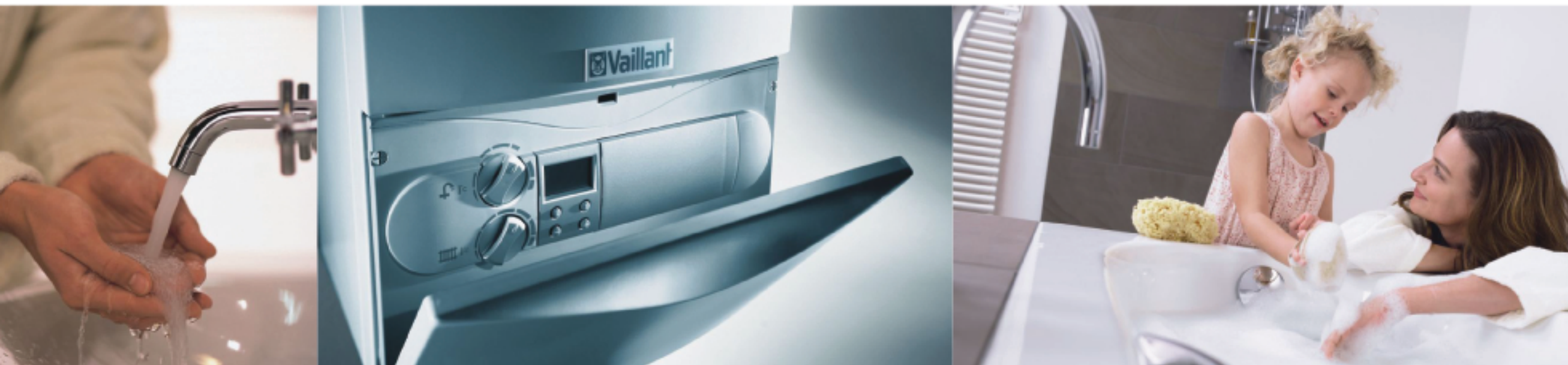
VUI aquaPlus 280/7 282/7